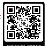
Online Ausgabe Lagerzeitung

PS. Wer die Lagerfahne klaut - verlässt umgehend mit seiner gesamten Jugend- gruppe das Zeltlager! Fahne weg = Feuer aus