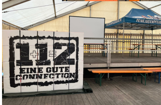
Die Bühne nimmt Gestalt an, Leinwand, Licht- & Soundtechnik wurde aufgebaut, der Karaoke Party heute Abend steht nichts im Weg.