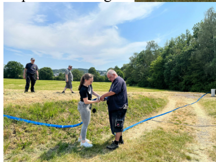
Kuppeln will gelernt sein, selbst mit ü 60 & u 20