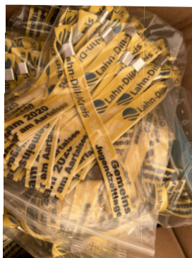
Was wohl oben rechts im Bild in den Kartons ist? Richtig, die Teilnehmerbändchen und T-Shirts.