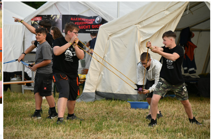
Altenkirchen-Bellersdorf macht Luftangriffe