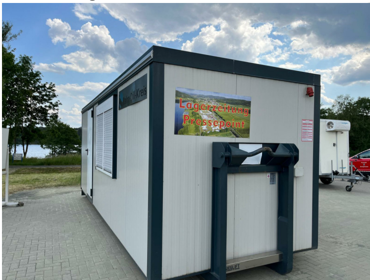
Neuer Standort der Lagerzeitung / des Pressepoint

Dieses Jahr findet ihr uns unterhalb des Versorgungszeltes (nicht wie im Übersichtenplan dargestellt oberhalb) im "Abrollbehälter Aufenthalt" des Lahn-Dill-Kreises, im Bereich der gepflasterten Wohnmobilstellplätze. Wir werden täglich für euch die interessantesten Geschichten aufbereiten. Zum Frühstück habt ihr dann die aktuelle Ausgabe in der Hand, oder zur späten Stunde schon vorab Online (siehe Seite 2 dieser Ausgabe).