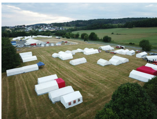
Die Plätze füllten sich weiter mit Zelten