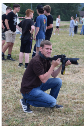
Reporter des Tages