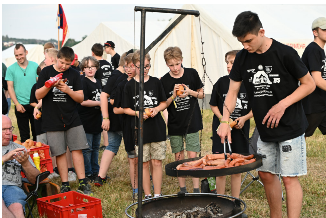
Würstchenparty in Greifenstein